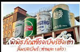
พิพิธภัณฑ์โรงเบียร์ชิงเต่า คิมรคเบียร์ (ทานคะ 1 แก้ว)