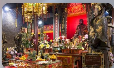
วัดปึกไท้

THE LUXE MANOR HOTEL หรือเทียบเท่า 4-5 ดาว