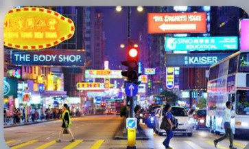
จิมซาจู้