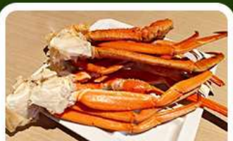
เมนูพิเศษ! ขาปู