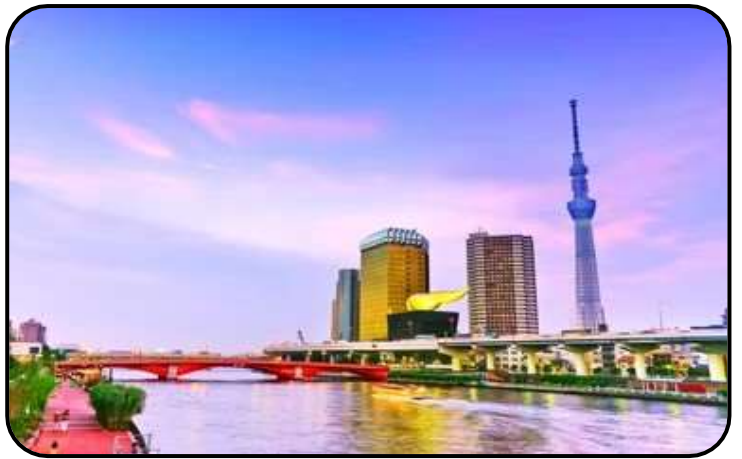
แม่น้ำสุมิตะ

สักการะ วัดมัตสึจิยามะโชเต็น หรือ “วัดหัวไชเท้า” ซึ่งเป็นวัดเก่าแก่ในย่านอาซากุสะ เป็นวัดเก่าแก่ในย่านอาซากุสะ กรุงโตเกียว ตั้งอยู่บนเนินเขาเล็ก ๆ ริมแม่น้ำสุมิตะ จุดเด่นคือเป็นวัดที่ขึ้นชื่อเรื่อง “ขอพรด้านการเงิน” โชคลาภ และความสำเร็จในธุรกิจ ส่วนไฮไลต์สำคัญของวัดนี้คือ ไคคอน หรือหัวไชเท้า สัญลักษณ์ศักดิ์สิทธิ์ คนที่นี้เชื่อว่าไคคอนช่วย “ชำระล้างสิ่งไม่ดี” และนำโชคลาภเข้ามา นักท่องเที่ยวมักนำไคคอนไปถวายเพื่อขอพร