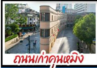
ถนนเก๋าคูหนิง