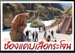
ช่องแคบเสือกะโจน