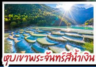
ตูปเขาพระจันทร์สีน้ำเงิน