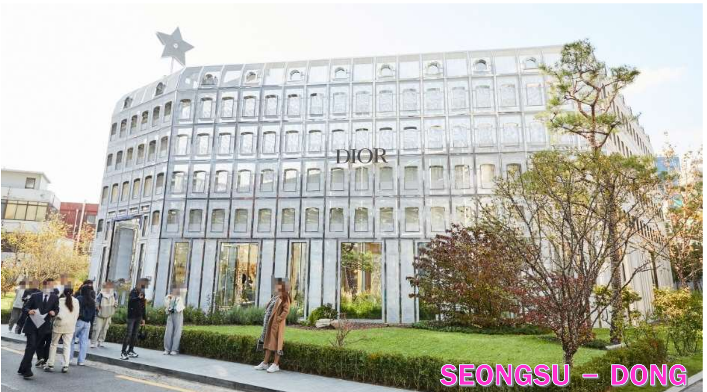
SEONGSU - DONG

กลางวัน รับประทานอาหารกลางวัน ณ ภัตตาคาร เมนูเทศกาลปี เมนูขึ้นชื่อจากเมือง ซุนซอน เป็นอาหารเกาหลีรสเผ็ดหวานที่โดดเด่นด้วยเนื้อไก่หมักซอสโคชูจังเข้มข้น ผสมพริกป่น กระเทียม ซีอิ๊ว และเครื่องปรุงสูตรพิเศษ หมักจนซึมเข้าเนื้อ ก่อนนำไปผัดบนกระทะร้อนพร้อมกะหล่ำปลี หอมใหญ่ มันหวาน และเส้นต็อกเหนียวนุ่ม ให้รสชาติกลมกล่อม หอมเครื่องเทศ นิยมรับประทานร้อน ๆ คู่กับข้าวสวย หรือเพิ่มซีสียัด ๆ เพื่อเพิ่มความเข้มข้นและความอร่อยยิ่งขึ้น