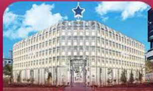
ชานซองซู