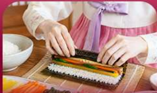
เรียงหน้าทำคิมบับ

สัมผัสเสน่ห์ฤดูหนาวของเกาหลีแบบอบอุ่นหัวใจพิเศษ! พักที่รีสอร์ท 1 คืน ท่ามกลางบรรยากาศหิมะขาวโพลน สนุกกับกิจกรรมฤดูหนาวยอดนิยม ทั้งสกี สโนว์บอร์ดและสโนว์สไลด์ ก่อนออกเดินทางสู่เกาะนามิ ดินแดนแห่งความโรแมนติก ชมสตรอว์เบอร์รี่หวานฉ่ำ สด ๆ จากฟาร์ม พร้อมเรียนทำคิมบับเมนูยอดฮิตสไตล์เกาหลี ปิดท้ายด้วยการช้อปปิ้งสุดฟินที่เมืองคยองและซองซู ย่านอิตกิสายคาเฟ่และสายแฟชั่นทันสมัย