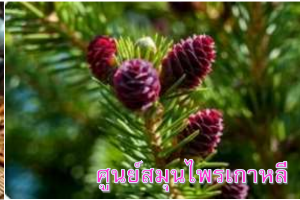
ศูนย์สมุนไพรเกาหลี

หลังจากนั้นนำท่านเดินทางสู่ย่าน เมียงดง (MYEONGDONG) ย่านช้อปปิ้งใจกลางกรุงโซลที่เต็มไปด้วยร้านค้า ห้างสรรพสินค้าชื่อดัง ร้านอาหารริมทางมากมาย โดยเมียงดงนั้นเป็นแขวงหนึ่งในเขตกรุงโซล มีพื้นที่เป็นที่ตั้งของร้านค้ากระจายตัวไปทั้งฝั่งตะวันออกและตะวันตก มีห้างสรรพสินค้าขนาดย่อม มีร้านขายสินค้าแบรนด์เนมมากมาย และยังมีสถานที่ท่องเที่ยวอันเป็นแลนด์มาร์กยอดนิยมมากมายด้วย อิสระให้ท่านได้เดินเล่นเลือกซื้อสินค้าตามอัธยาศัย