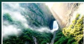
เขาประตูลำธาร