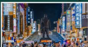
ถนนแดนแดนเซี่ยงซี