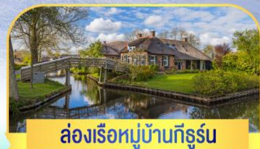
ล่องเรือหมู่บ้านทีรูร์น