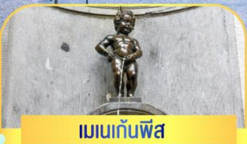
เมเนกันฟิส