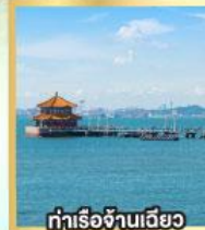
ท่าเรือจ้านเฉียว