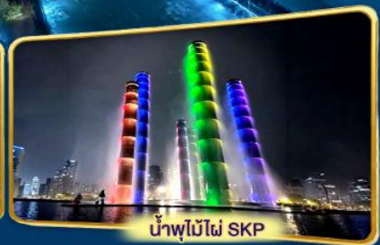
น้ำพุไม้ไฟ SKP