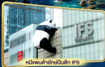
หมีแพนด้ายักษ์ปีนตึก IFS