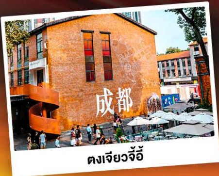
ตงเจียวจี้

เที่ยวภูเขาแอลป์แห่งเมืองจีน ชมความงามของ "อุทยานภูเขาสีดรุณี"