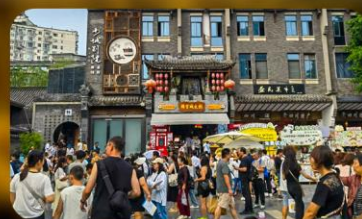
ถนนชอยกวางชอยแคบ